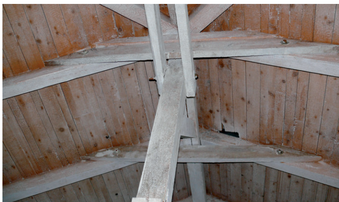
Foto z realizace nátěru Flamgard

Povrchy chráněné protipožárním nátěrem nesmí přijít do kontaktu s vodou ani jinými čistícími prostředky. Povoleno je pouze suché čištění (prachovka, vysavač).