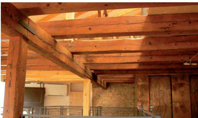
Foto z realizace nátěru Flamgard Transparent

Aplikace vrchního Krycího laku [S 1818] se provádí pouze v jedné vrstvě. Povrchy chráněné protipožárním nátěrem nesmí přijít do kontaktu s vodou ani jinými čistícími prostředky.